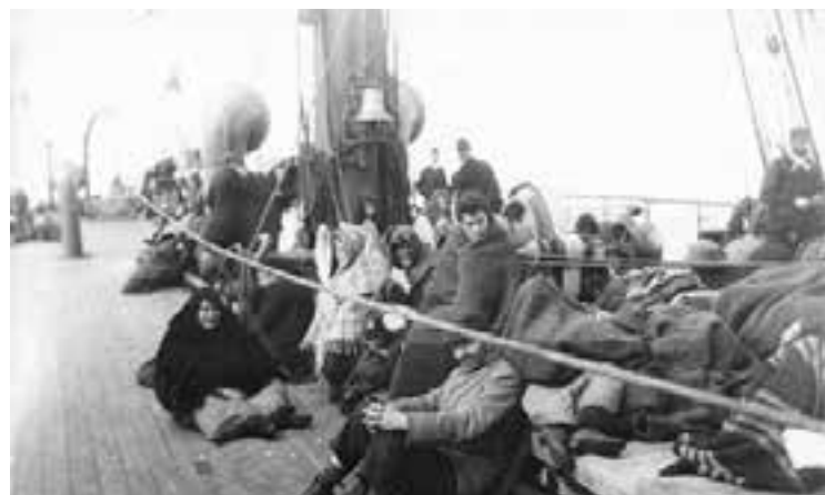
Vystáhovalci na lodi. Rok 1892

Kompletný materiál s tabuľkovým zoznamom vystáhovalcov bude zverejnený na internetovej stránke obce www.obecchlebnice.sk .