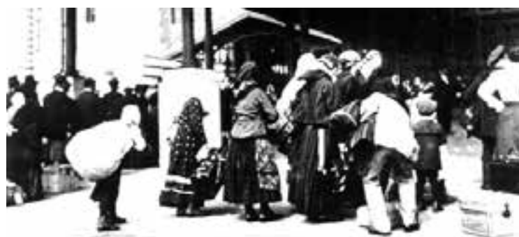
Čakanie pred vchodom do Imigračného úradu na lekársku prehliadku a vstupný pohovor s imigračným úradníkom.