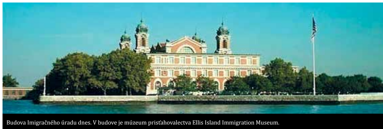
Budova Imigračného úradu dnes. V budove je múzeum prístáhovalctva Ellis Island Immigration Museum.