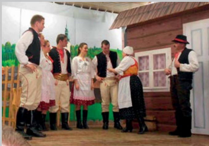
Divadelní ochotníci odohrali v tradičnom termíne, 26. decembra, novú inscenáciu.