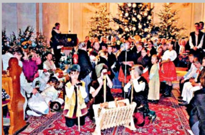
Jasličková slávnosť zohrala srdcia Chlebničianov v Prvý sviatok vianočný.