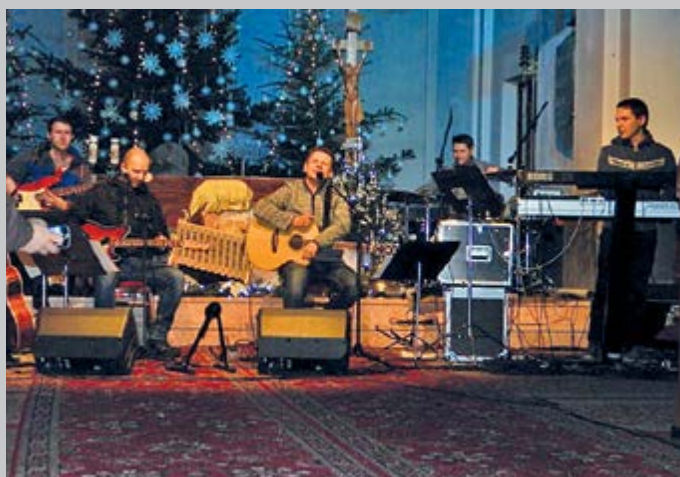
Gospelovej kapele Kéfas sa po ostatnom koncerte v Chlebniach zapáčilo natoľko, že prišli zahrať opäť. Tentoraz sa koncert uskutočnil 3. januára v kostole.