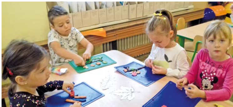
Pripravila ZŠ s MŠ